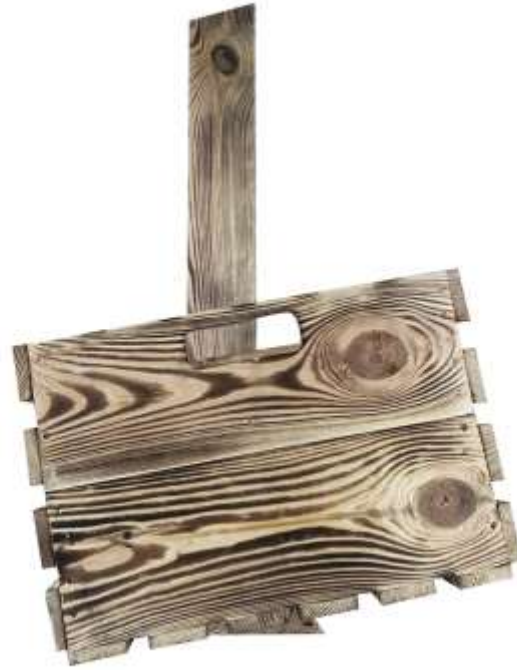
UNTERE KISTE POSITIONIEREN DEN NEIGUNGSWINKEL VON DER OBEREN ABSCHLUSSKANTE ÜBERNEHMEN