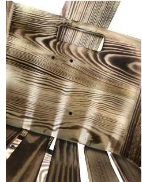
MIT DEN MITGELIEFERTEN SCHRAUBEN VON INNEN FIXIEREN – KEINE VORGEBOHRTEN LÖCHER